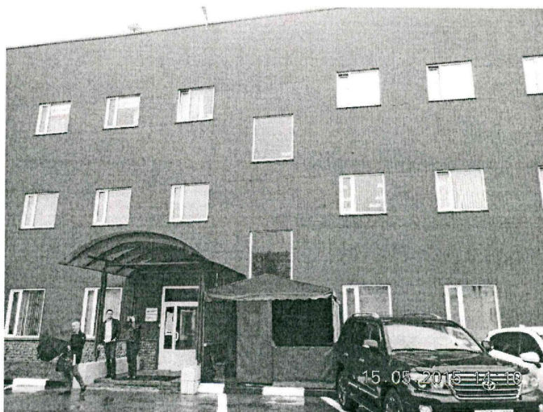
г. Москва, Партийный пер., д. 1, корп. 58, стр. 1.

Среди арендаторов и субарендаторов помещений по данному адресу по состоянию на 25.05.2015 нет ООО «БизнесМаркет».