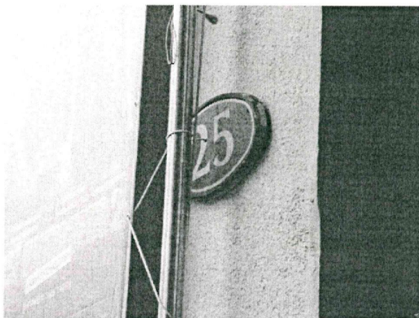
Указатель адреса на здании кинотеатра «Пять звезд»