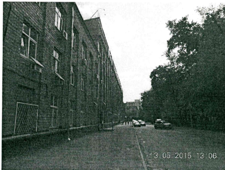
Здание собственника помещений по адресу: г. Москва, Партийный пер., д. 1.

В настоящее время Испытательная лаборатория ООО «БизнесМаркет» заявила о переезде по адресу: г. Москва, Партийный пер., д. 1, корп. 58, стр. 1. По новому адресу должно быть размещено все оборудование лаборатории.