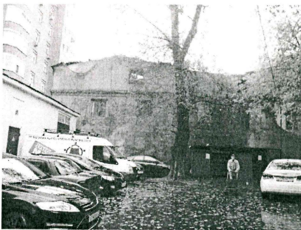
Пристрой к зданию по адресу: г. Москва, ул. Бахрушина, д. 25. Вид с площадки за зданием.

С адресом г. Москва, ул. Бахрушина, д. 25 или г. Москва, ул. Бахрушина д. 25, стр. 1 не связана ни одна лицензия Роспотребнадзора на проведение работ с возбудителями инфекционных заболеваний. При этом в области аккредитации продукция и ТР ТС «О безопасности пищевой продукции», ТР ТС «Технический регламент на масложировую продукцию», ТР ТС Технический регламент на соковую продукцию из фруктов и овощей» ТР ТС «О безопасности отдельных видов специализированной пищевой продукции, в том числе диетического лечебного и диетического