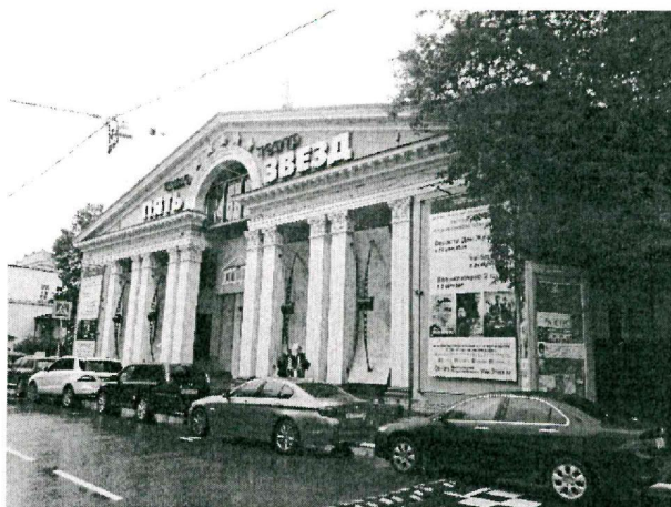
Здание по адресу: г. Москва ул. Бахрушина, д. 25 занято кинотеатром «Пять звезд». Испытательной лаборатории в нем нет.