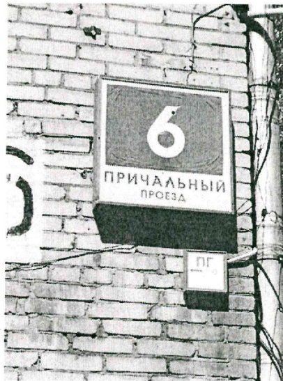
Указатель адреса на здании.

Здание по адресу: г. Москва, Причальный пр., д. 6, где на 5 этаже должна была размещаться испытательная лаборатория «ЛСМ» ООО «Трансконсалтинг» и проводить, химические, микробиологические и механические испытания продукции. Вид с проходной на территорию.